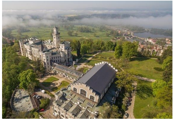
Schloss Hluboká nad Vltavou, distanz 50 km.