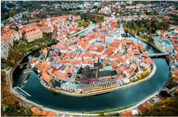
Historische stadt Český Krumlov, distanz 20 km.